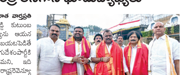
తిరుమల, అక్టోబర్ 29 ప్రభాతవార్త ప్రతినిధి

- వైఎస్సార్స్ పుట్టిందే అబద్ధాల పునాదిపైన - మంత్రి అనగాని ఘాటువ్యాఖ్యలు